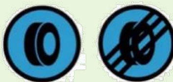
TYRE MARKING/CHECKING ZONE MARQUAGE/VERIFICATION PNEUS