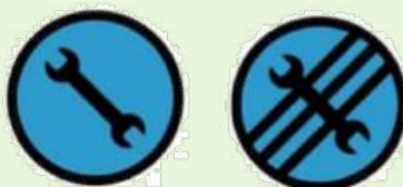
REMOTE SERVICE ZONE ZONE D'ASSISTANCE ÉLOIGNÉS