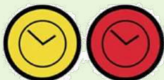
TIME CONTROL CONTRÔLE HORAIRE

Color of control area entry: YELLOW Color of control: RED Couleur de début de zone: JAUNE Couleur du contrôle: ROUGE