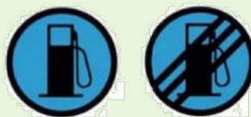
REFUEL ZONE ZONE DE RAVITAILLEMENT