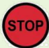
STOP CONTROL CONTRÔLE STOP

Color of control area entry: YELLOW Color of control: RED Couleur de début de zone: JAUNE Couleur du contrôle: ROUGE