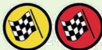
FLYING FINISH LINE LIGNE D'ARRIVEE LANCEE

Color of control area entry: YELLOW Color of control: RED Couleur de début de zone: JAUNE Couleur du contrôle: ROUGE