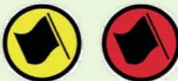
SS START DEPART DE SS

Color of control area entry: YELLOW Color of control: RED Couleur de début de zone: JAUNE Couleur du contrôle: ROUGE