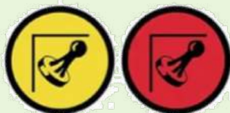
PASSAGE CONTROL CONTRÔLE DE PASSAGE

Color of control area entry: YELLOW Color of control: RED Couleur de début de zone: JAUNE Couleur du contrôle: ROUGE