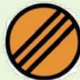
END OF CONTROL ZONE FIN DE LA ZONE DE CONTRÔLE

Color of control area entry: YELLOW Color of control: RED Couleur de début de zone: JAUNE Couleur du contrôle: ROUGE