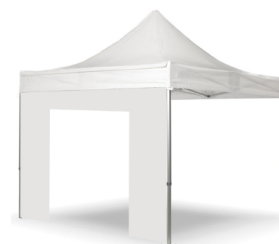
ALTRE COPERTURE L